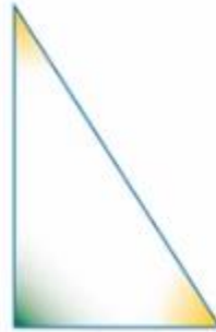
De rechthoekige driehoek